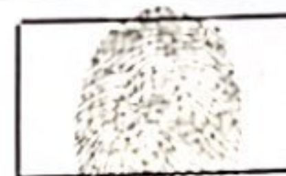
Huella Índice Derecho